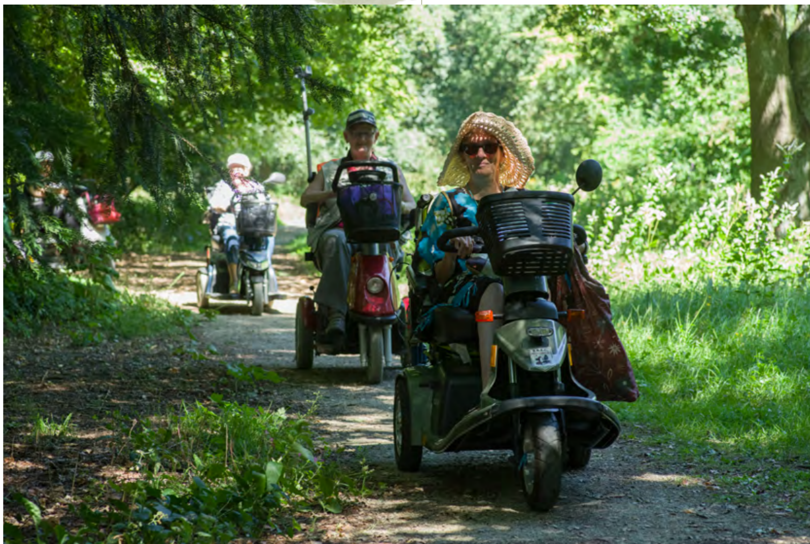
ENKELE SCOOTMOBILECLUBLEDEN BRACHTEN ONS EEN BEZOEK

Verderop op de heideheuvel staan een paar Hazelaars met takken waarvan er een aantal dood zijn. Het was dus hoog nodig om die te verwijderen om de andere takken meer ruimte te geven. Het waren er meer dan we dachten, dus was het nog een heel karwei op deze warme middag, maar nu ziet het er weer goed uit.