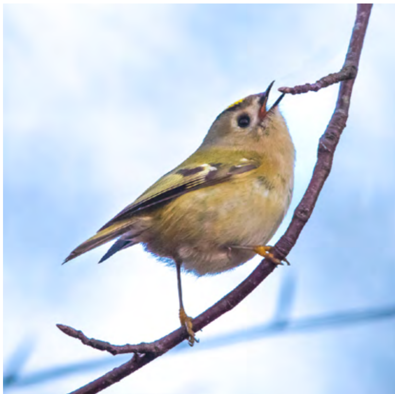
'T GOUDHAANTJE LAAT ZICH STEEDS VAKER ZIEN