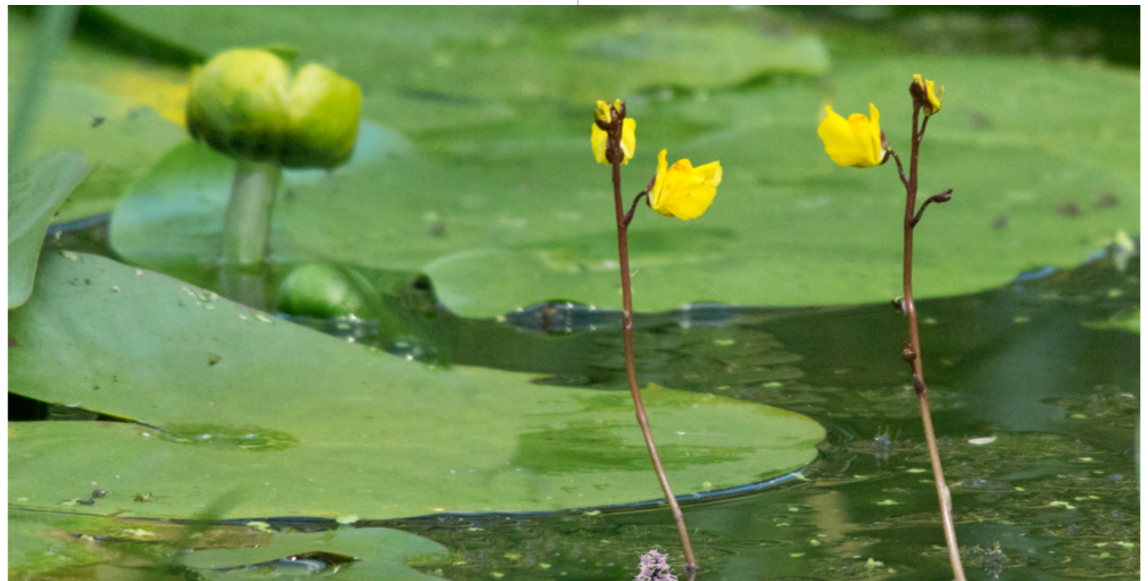
HET ZELDZAME GROOT BLAASJESKRUID IN ONZE VIJVER