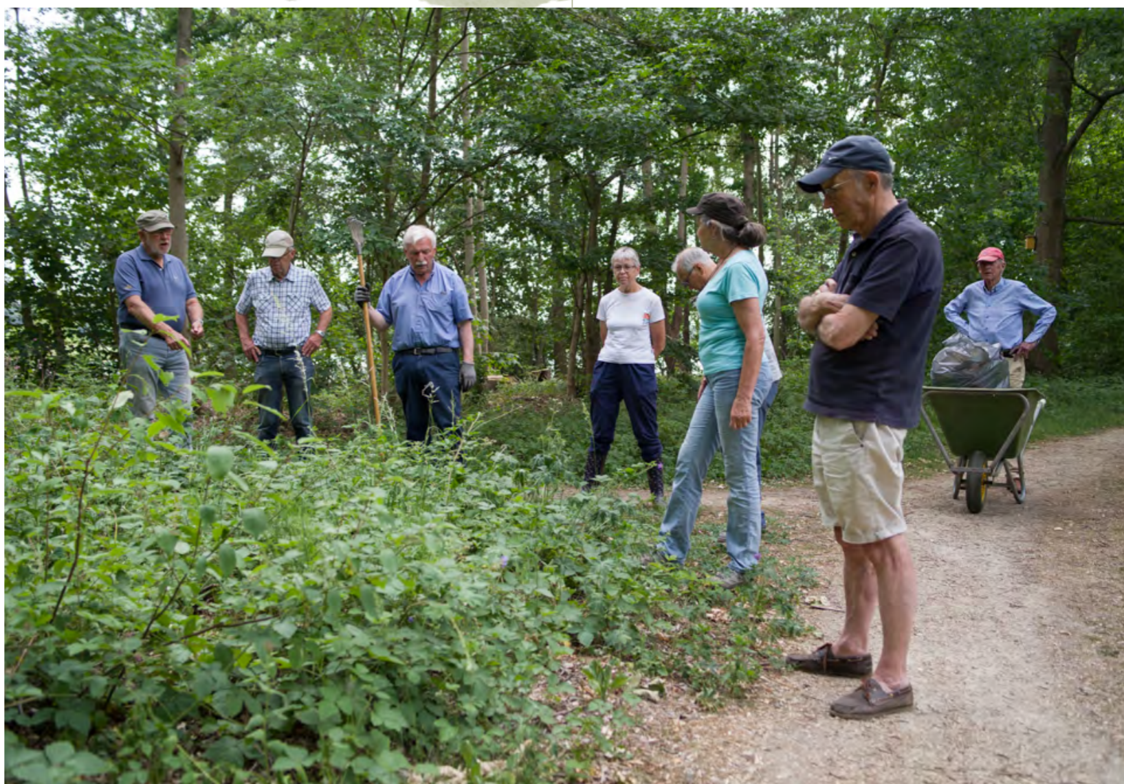
GEZAMENLIJK RONDJE DOOR HET PARK

We kregen ook nog bezoek van de NIEUWE WIJKAGENTE ; zij was nog nooit in ons park geweest, dus ging er een wereld voor haar open.