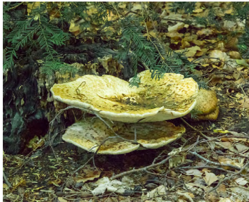
EN ALS HET VEEL REGENT ZIE JE OPEENS EEN ZWAM VAN WEL 40 CM DOORSNEE

is zal altijd een raadsel blijven. Omdat het nu het groeiseizoen is en het weer wat heeft geregend zijn de BRAAM-STRUIKEN EN ABEELSCHOUTEN weer volop gaan groeien. Die zijn we nu aan het VERWIJDEREN om teveel wildgroei te voorkomen. Vooral langs het pad achter de heideheuvel hebben we veel Abeelschouten verwijderd. Daar zijn we al vaker bezig geweest maar nog steeds zitten er dikke onder de grond doorgroeiende wortels. Daar groeien die nieuwe scheuten aan. We houden het goed in de gaten, er mag van alles groeien in ons park maar het liefst alleen daar waar wij het