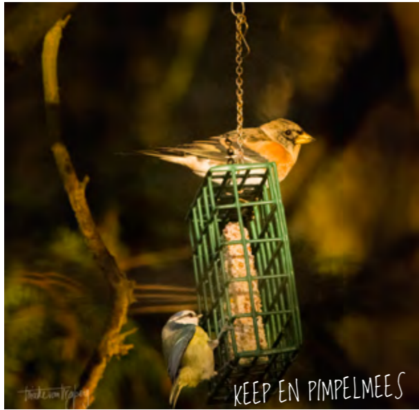
KEEP EN PIMPELMEE'S